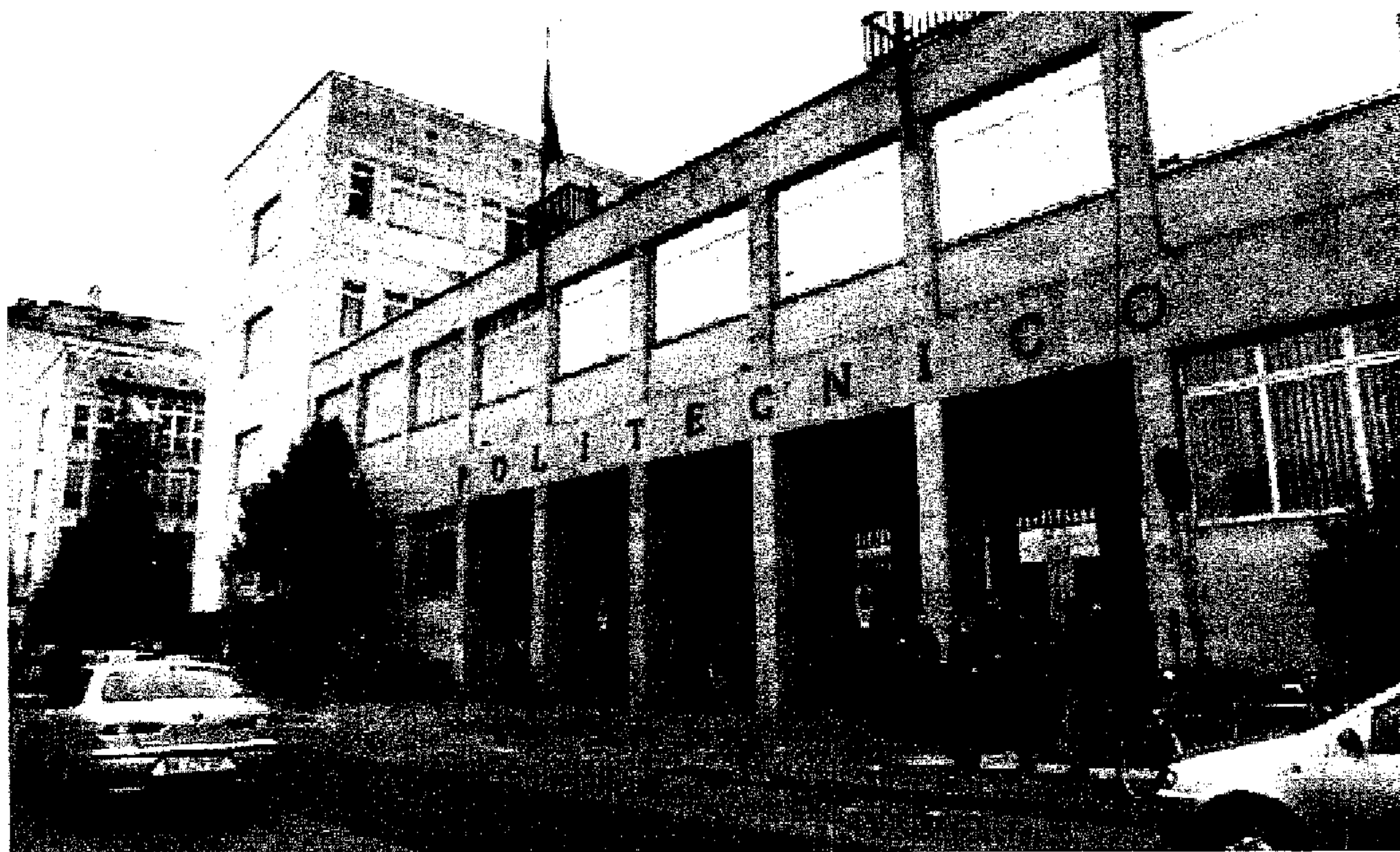
CARRIERA & FUTURO Il Politecnico di Torino ha ospitato l'evento giunto quest'anno alla sua undicesima edizione

Carriera & Futuro, evento unico nel suo genere per tutto il Nord Ovest, è organizzato da J.E.To.P., Junior Enterprise del Politecnico di Torino, una vera e propria realtà imprenditoriale gestita da studenti universitari.