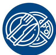
Ristoranti e Pizzerie