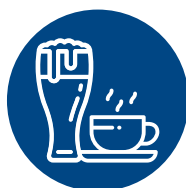
Bar, Pub e Tabacchi