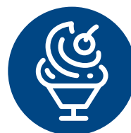
Gelaterie e Cremerie