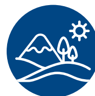
Agriturismi e rifugi