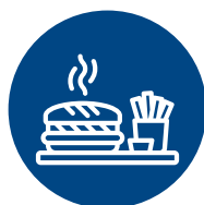
Fast-food e Street-food